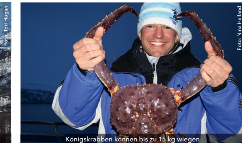
Königskrabben können bis zu 15 kg wiegen