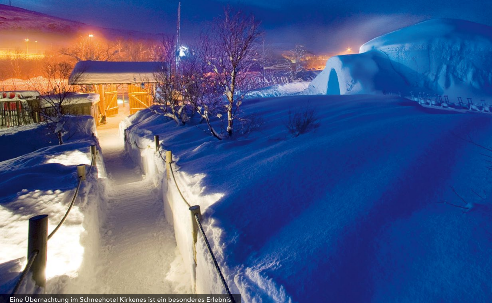
Eine Übernachtung im Snowhotel Kirkenes ist ein besonderes Erlebnis

Gehen Sie auf eine beeindruckende Eisenbahnfahrt mit der Flåm-Bahn, die Sie auf steilen Schienentrassen vorbei an spektakulären Wasserfällen und schneebedeckten Berggipfeln bis zum Aurlandsfjord führt. Oder entdecken Sie den Sognefjord, Norwegens längsten und tiefsten Fjord, per Schiff und Zug. Sie können auch ganzjährig auf Königskrabben-Safari gehen oder – nur im Winter – im Snowhotel übernachten.