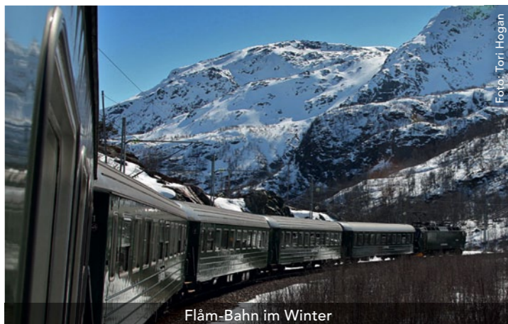
Flåm-Bahn im Winter

Gehen Sie auf eine beeindruckende Eisenbahnfahrt mit der Flåm-Bahn, die Sie auf steilen Schienentrassen vorbei an spektakulären Wasserfällen und schneebedeckten Berggipfeln bis zum Aurlandsfjord führt. Oder entdecken Sie den Sognefjord, Norwegens längsten und tiefsten Fjord, per Schiff und Zug. Sie können auch ganzjährig auf Königskrabben-Safari gehen oder – nur im Winter – im Snowhotel übernachten.