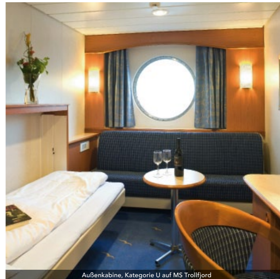
Außenkabine, Kategorie U auf MS Trollfjord

Alle Abbildungen zeigen beispielhaft die unterschiedlichen Kabinenkategorien. Da die Schiffe unterschiedlich groß sind und aus verschiedenen Baujahren stammen, kann es innerhalb einzelner Kabinenkategorien und bezüglich der Beschreibungen zu Variationen in Schnitt, Größe und Bettenstellung kommen.