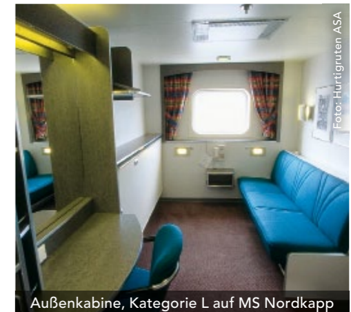
Außenkabine, Kategorie L auf MS Nordkapp