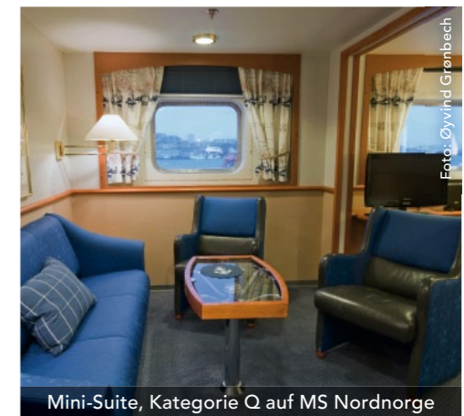
Mini-Suite, Kategorie Q auf MS Nordnorge