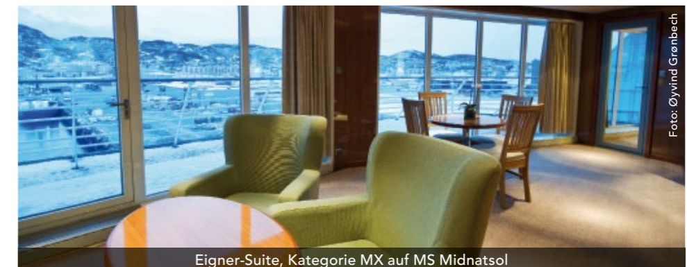
Eigner-Suite, Kategorie MX auf MS Midnatsol